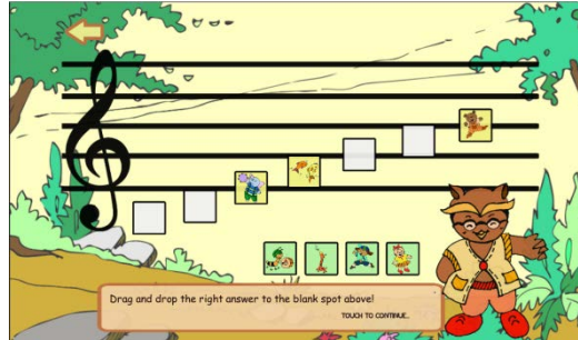
Gambar 4.1 Jungle Level 1

Hasil dari studi ini berupa aplikasi edukasi teori sight-reading berbasis Android untuk anak berusia 9 – 13 tahun. Gambar 4.1 menggambarkan contoh permainan yang pertama yaitu mengurutkan hewan sesuai dengan nama not. Sedangkan Gambar 4.2 menggambarkan permainan kedua yaitu melengkapi huruf yang hilang pada nama hewan, sesuai dengan nama not di atasnya.