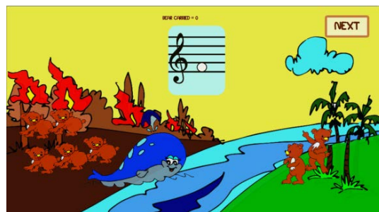
Gambar 4.3 Sea Level 1

Gambar 4.3 merupakan tipe permainan menebak time value dari not, dengan cara menyelamatkan beruang sejumlah not yang digambarkan di soal. Sedangkan gambar 4.4 adalah permainan tapping ritme dari lagu.